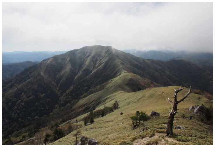
▲ 剣山からの次郎笈

笹原の山容が美しい剣山の紅葉をゆっくり楽しむチームと次郎笈まで頑張る2チームに別れ登りました。山頂は風が冷たかったのですが、今年初の霧氷も楽しみ思わぬご褒美でした♪