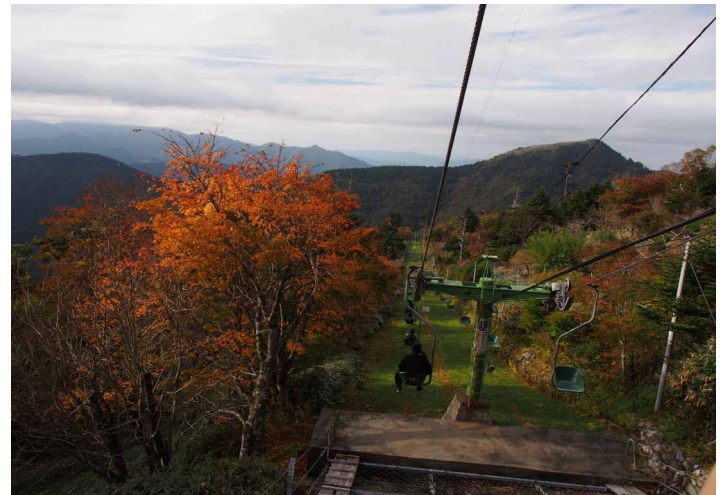
▲ リフトでも紅葉を楽しめます